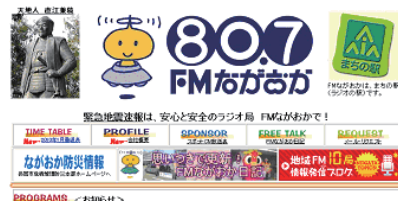
安心と安全のラジオ局 (FM ながさか HP より)

新潟: ラジオチャット(新潟)、FMピッコロ(柏崎)、エフエムけんとう(新潟)、RADIO AGATT(新発田) FMゆきぐに(南魚沼)、FMながさか、ラジオは〜と(燕・三条)、FM-J(上越) ほかほかラジオ(新潟)、ほっこりラジオ(十日町) 富山: ラジオたかおか、City-FM(富山)、ラジオムー(黒部) エフエムとなみ、エフエムいみず