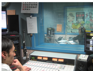
街角の放送局 (むさしのエフエム)