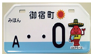
エビアミーゴのご当地プレート