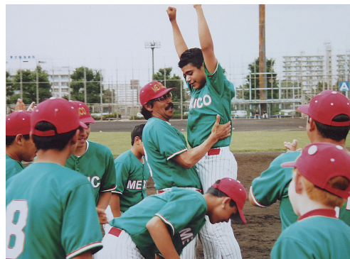
メキシコの子供たち